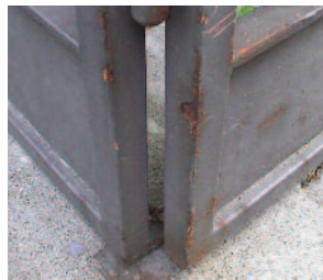
Eingangstor (nach 24 J.) 3-Schicht-Beschichtung