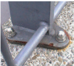
Geländer (nach 14 J.) 3-Schicht-Beschichtung