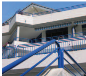
Balkon- und Brüstungsgeländer, Duplexverfahren