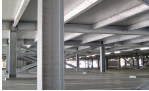
Innenansicht, Träger und verzinkte Stützen Realisiertes System: Feuerverzinkung, mind. 100 µm, Praxiswert 300 µm, Kosten: CHF 16.-/m 2