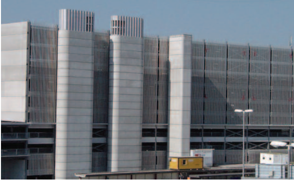
Aussenansicht Ausgeschriebenes System: 3-Schicht-Beschichtung mind. 150 µm, Kosten: CHF 23.-/m 2