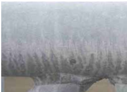
Weissrost entstanden durch Regen auf frisch verzinkte Konstruktion

Weissrost kann entstehen, wenn frisch verzinkte Oberflächen in Kontakt mit Feuchte kommen, zum Beispiel durch Niederschlag oder Kondenswasser-Bildung. Auf trockenen Zinkflächen bildet sich wenige Tage nach dem Feuerverzinken eine schützende Deckschicht (Zinkpatina), welche die Weissrostbildung verhindert. Das Auftreten von Weissrost ist daher kein Massstab für die Qualität der Verzinkung, vielmehr ist es das Ergebnis einer unsachgemässen, nassen Lagerung.